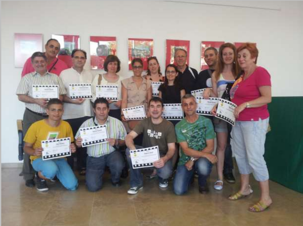
Entrega de diplomas alumnos/as Photoshop 2012