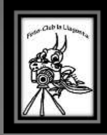
Foto-Club la Llagosta