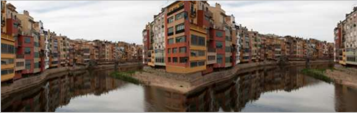
Díptico de Girona (imagen manipulada)