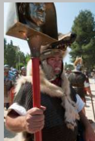
Tarraco viva 2012