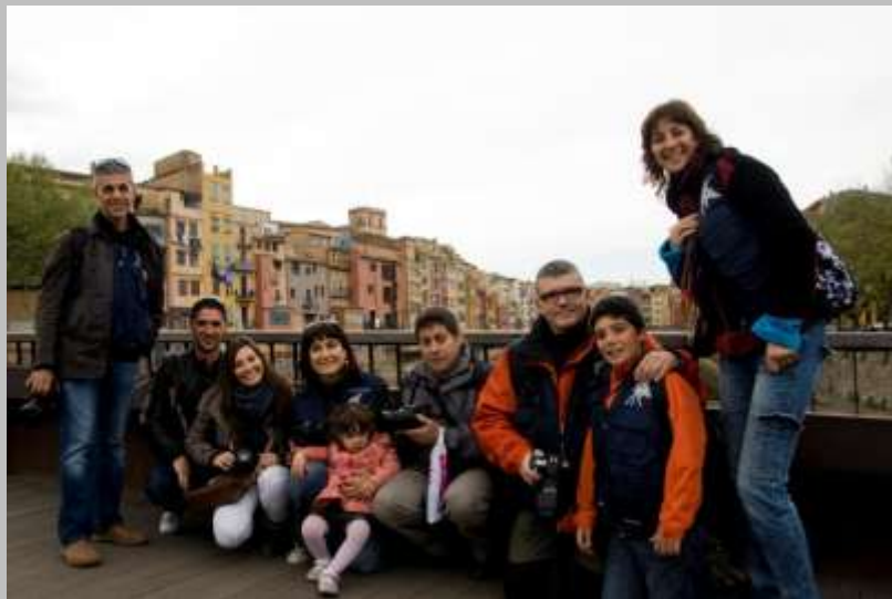
Foto de grupo, Girona 2012