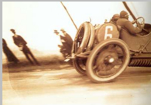
La salida en el Circuito de Picardía, 1907