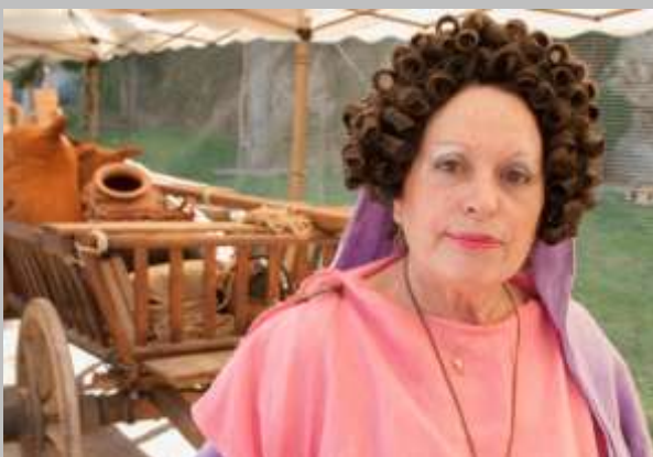
Tarraco viva 2012 (Tarragona)