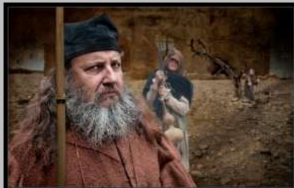
Festes de primavera 2012, Girona (Imagen manipulada)